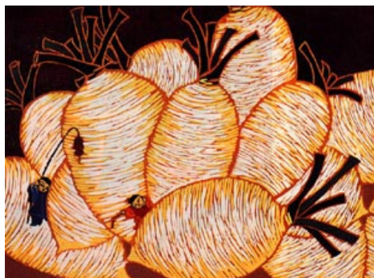
楊萬如 橡膠版 好彩頭